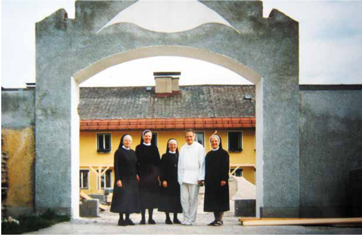
Klosterbau, Frühjahr 1994

Diesem Neubeginn waren tiefe innere und äußere Bewegungen vorangegangen, die im Kreuz von Gut Aich ihren Ausdruck finden. 57