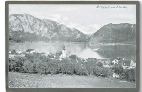
Unterach, auf einer Postkarte aus dem Jahr 1907.

Arbeit war nicht nur ein Teil des Lebens, sondern vielmehr dessen Grundlage und Voraussetzung. Sie gehörte dazu wie die Jahreszeiten, wie Sonne und Regen. So nahmen die Brüder lieber die Schande der unehelichen Niederkunft in Kauf, als dass sie die Schwester des Hofes verwiesen und damit eine wichtige Kraft verloren hätten. Die kleine Tochter wurde einfach in eine Decke gewickelt und mit aufs Feld genommen. Ein wahrhaft kühles Willkommen.