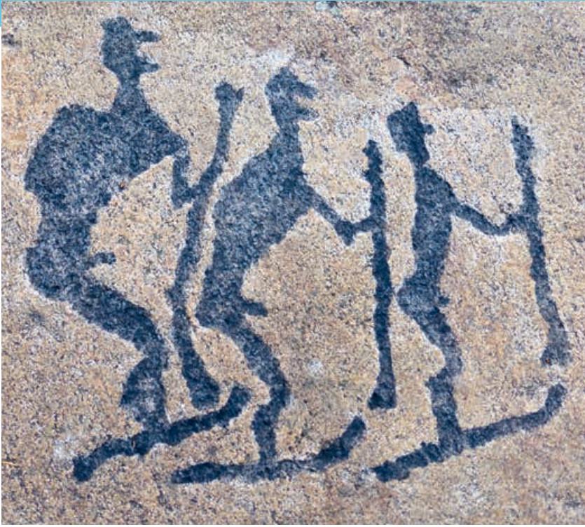
Felsritzzeichnungen, vorgefunden in den Küstengebieten des Weißen Meeres. Sie zeigen, dass man im nordwestlichen Russland bereits vor Tausenden Jahren Vorläufer des Skis als Fortbewegungsmittel nutzte.